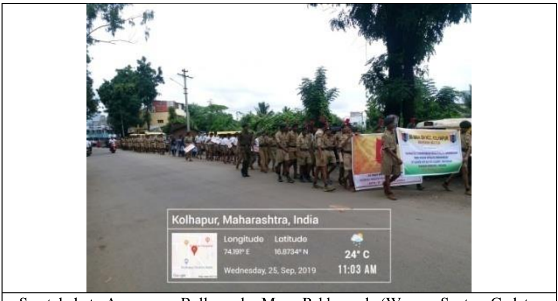
Swatchchata Awareness Rally under Mega Pakhawada (Warana Sector: Cadets, Officers, Staff and civilians 336) 25/09/2019