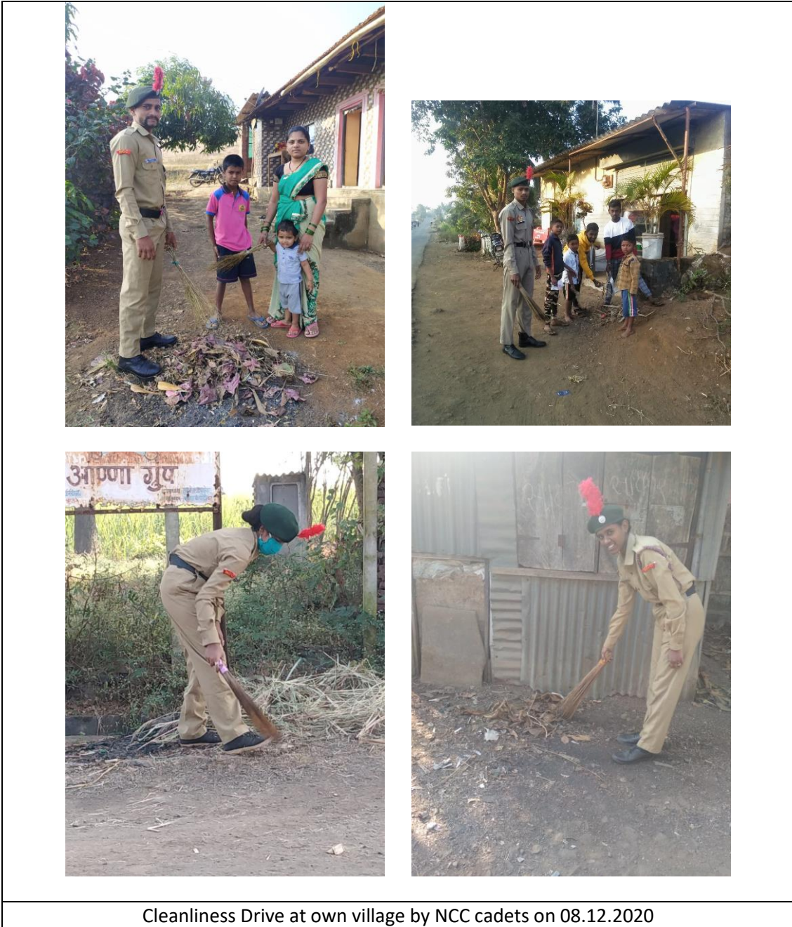
Cleanliness Drive at own village by NCC cadets on 08.12.2020