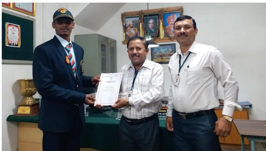
NCC Cadet awarded with 'Capt Jaysing George 'A' Jadhav Memorial Prize' by Shivaji University, Kolhapur for the contribution in Extension activities through NCC