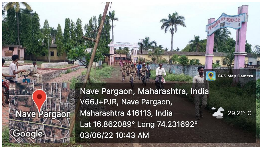
03.06.2022: Celebration of World bicycle Day in association with Parashar Highschool, Pargaon