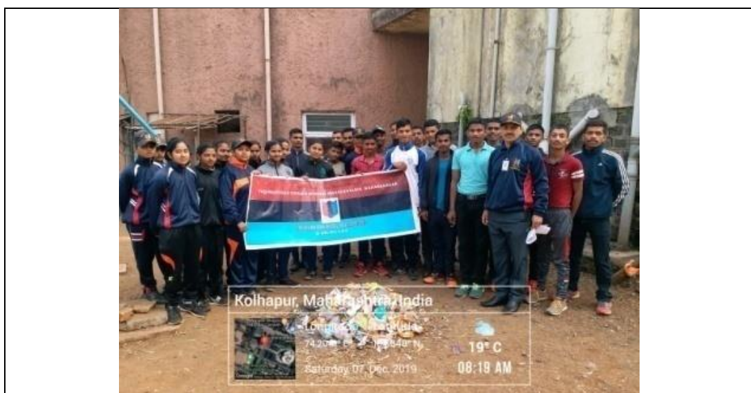
Plogging Activity: Plastic Cleanliness Drive on 07/12/2019