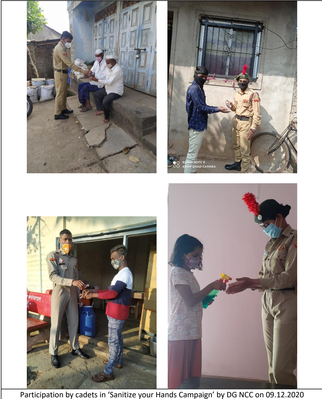
Participation by cadets in 'Sanitize your Hands Campaign' by DG NCC on 09.12.2020