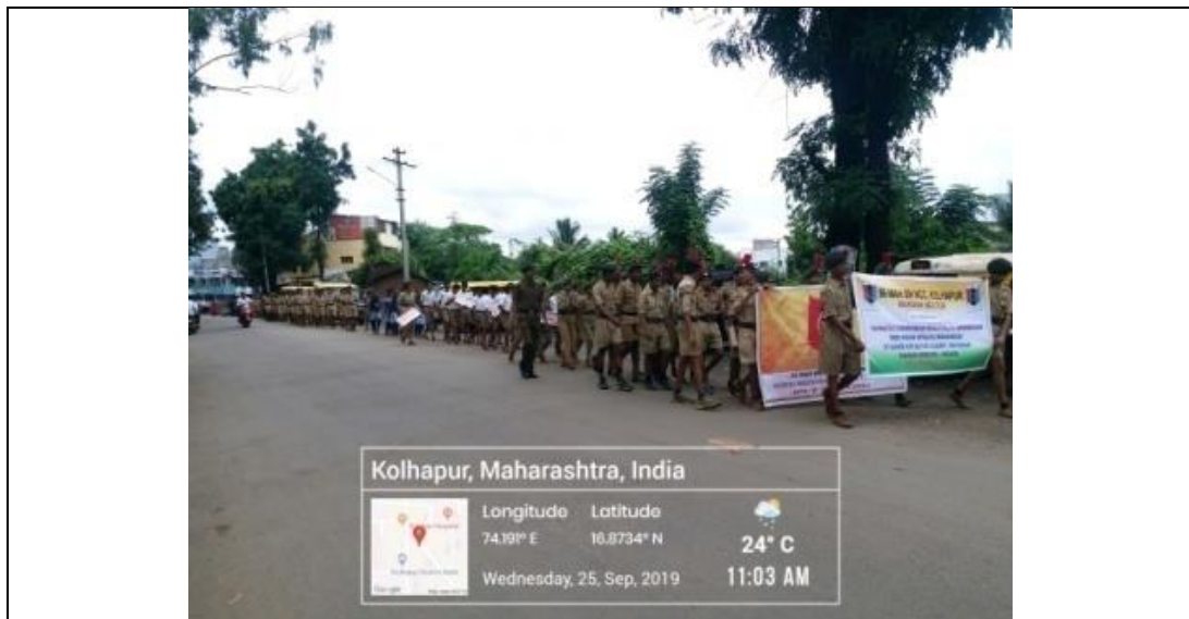
Swatchchata Awareness Rally under Mega Pakhawada (Warana Sector: Cadets, Officers, Staff and civilians 336) 25/09/2019