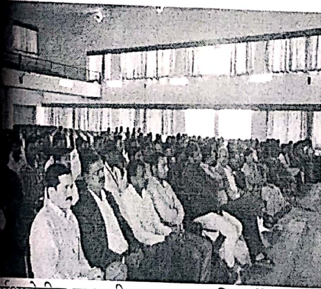
कार्यशाळेतील सहभागी प्राध्यापक व विद्यार्थी