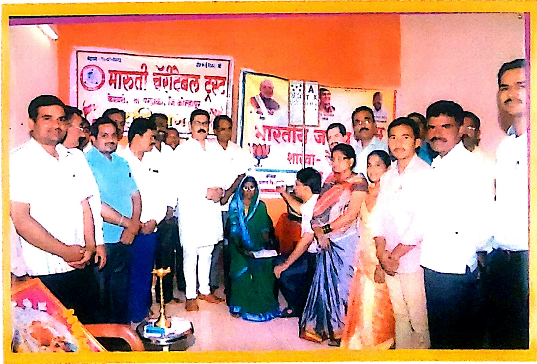
मोफत डोळे तपासणी शिबीर , भोजे केखेले ता-पजगाळा चेव्हे