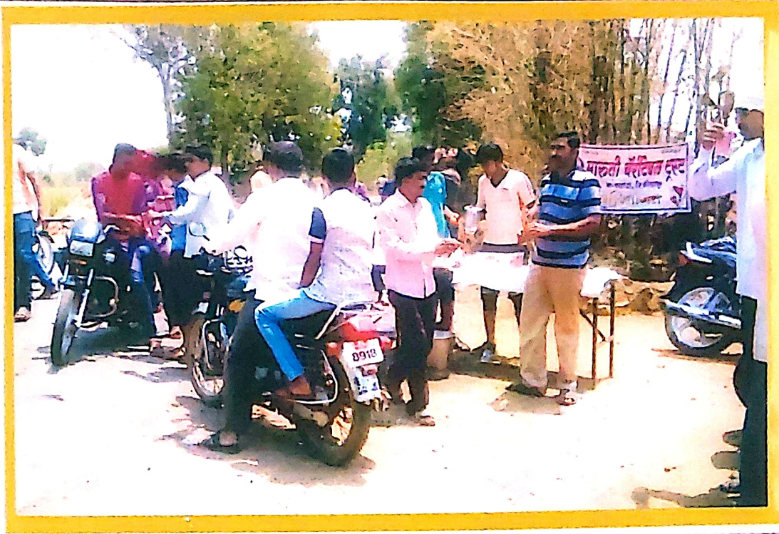
श्री ज्योतिर्लिंग यात्रे निमित्त यात्रेकरुना मोफत कोकमसरुवा वाटप