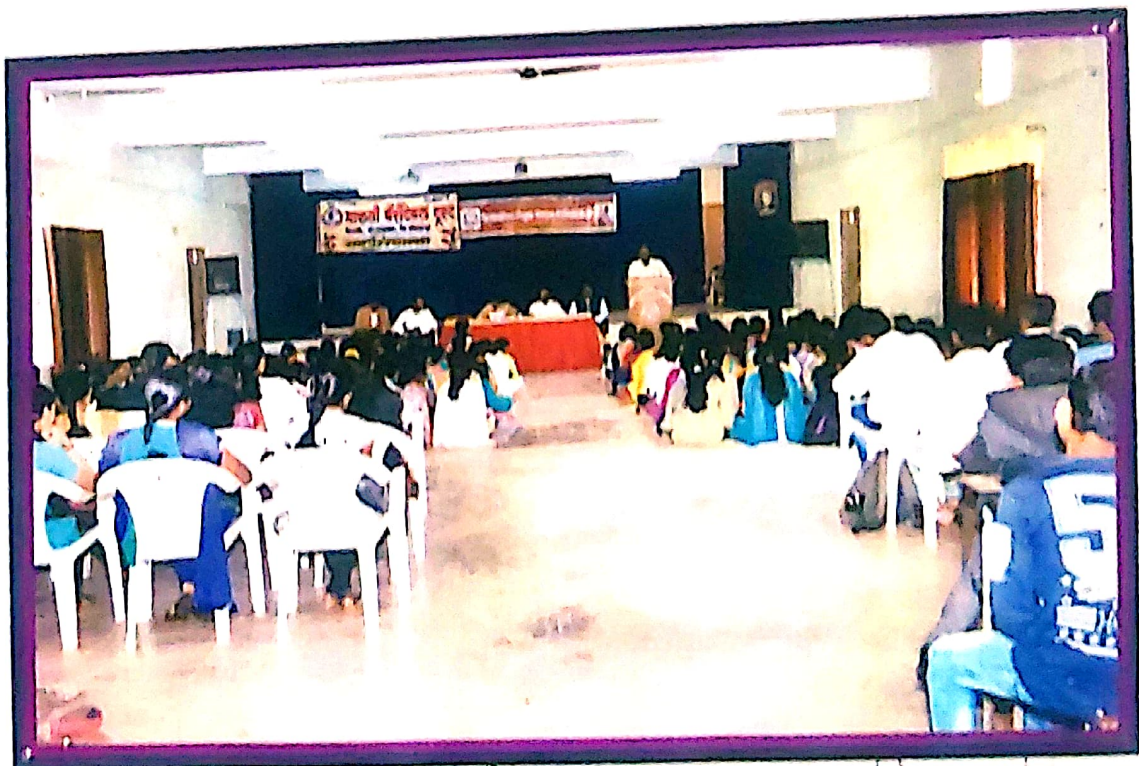
वारणा महाविद्यालय वारणानगर विभागांना मार्गदर्शन करणे आहूत माहितीपर कार्यक्रमा संस्थेच्या वतीने