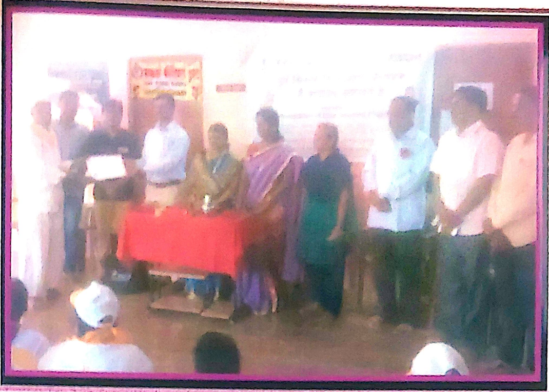
दुग्ध व्यवसाय प्रशिक्षण, अरिफिकेटे वाटप कार्यक्रमाचे वेळी