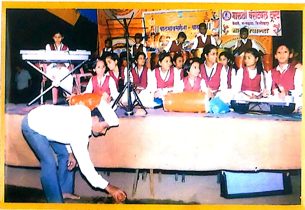
वायवुंद वाल्मीकी वारिशा सांस्कृतिक कार्यक्रमाचे वेळी वतीनी वेलका असता संस्थापक ङ्गि. पारील